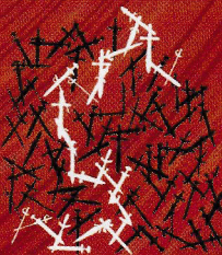
La voie de l'épée